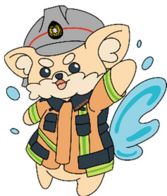
大阪南消防組合 マスコットキャラクター だいなんくん