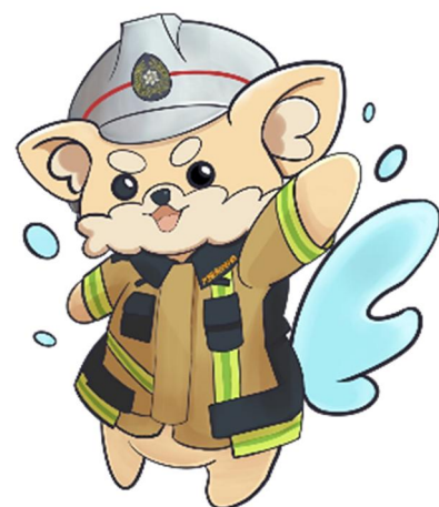
大阪南消防組合 マスコットキャラクター だいなんくん