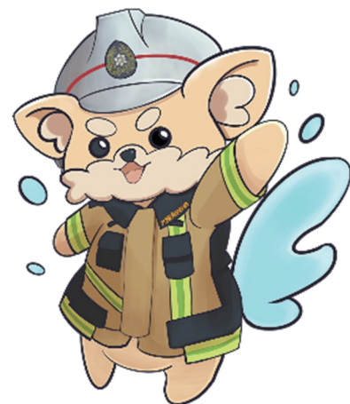
大阪南消防組合 マスコットキャラクター だいなんくん